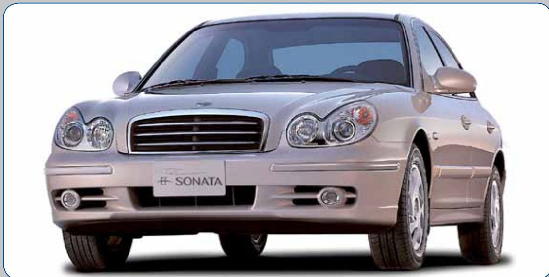
Sonata 2004 – nejspolehlivější vůz roku v Americe Sonata 2004 – the Most Reliable Car of the Year in America

Na konci 20. století čelila řada asijských společností a asijský trh krizi. Společnost Kia Motors neměla dostatek prostředků k dalšímu provozu; Hyundai toho využila a v roce 1998 tuto automobilku odkoupila a vytvořila skupinu Hyundai-Kia Motor Group. O rok později byl jmenován předsedou skupiny HKMG Mong-Koo Chung – o tom však až v příštím čísle.