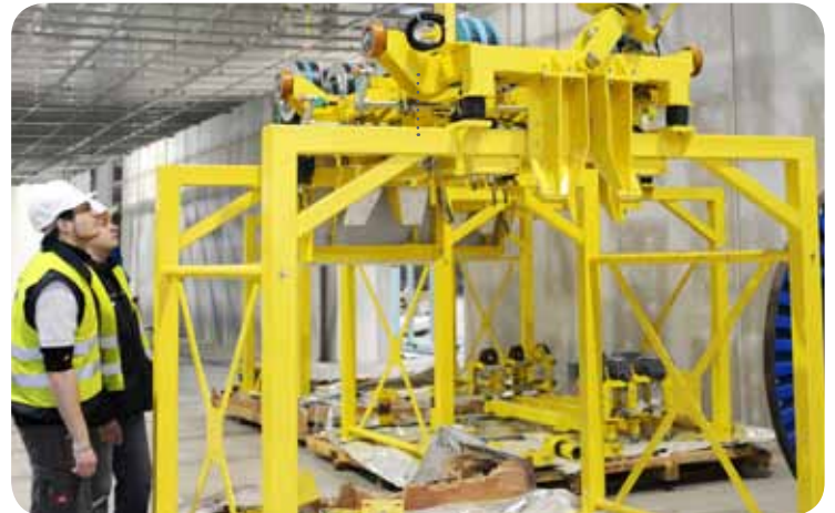
EMS dopravníky sloužící k přesunu karoserie na lince

: EMS Conveyors for Bodywork Moves on the Line