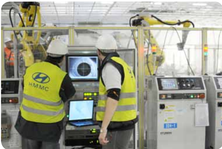
ACS – Autochecking system, který za pomocí 4 robotů kontroluje přesnost karoserie

: EMS Conveyors for Bodywork Moves on the Line