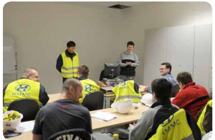
Generální manažer svařovny vítá nové zaměstnance

: ACS – System Checking the Accuracy of the Bodywork with 4 robots