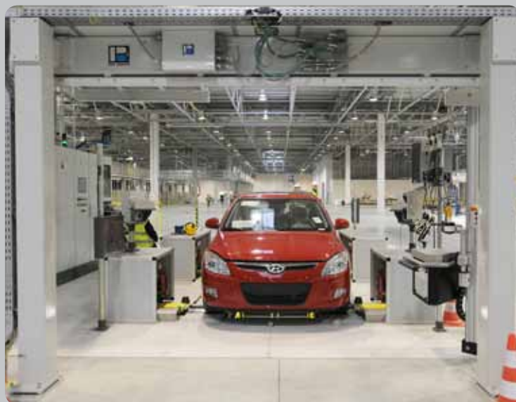
Testovací pozice, na níž probíhá např. seřizování geometrie či světel Testing Position, where e.g. wheel alignment and headlamp setting are done