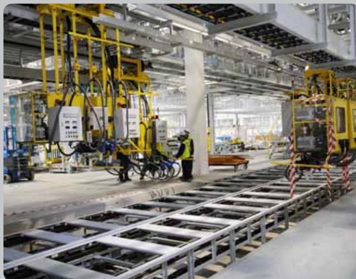
Část OK linky, na které se doplňují veškeré kapaliny Part of the OK line, where all liquids are filled up

Currently installation of devices continues in the shop. There are also i30 cars delivered from Korea. These will be used for tests of the line and for simulation of mass production.