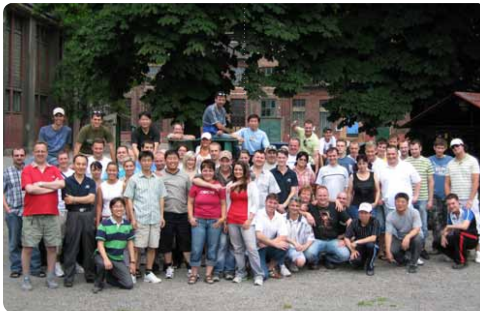
Snímek z teambuildingu oddělení lakovny Picture from Paint Shop teambuilding

Oddělení, která v letošním roce teambuilding doposud nepořádala, mohou této příležitosti využít ve zbývajících měsících