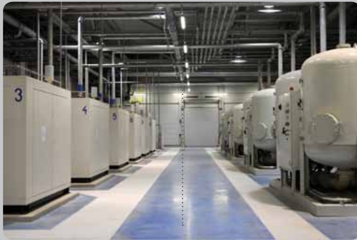
Kompresory (vlevo) a sušičky stlačeného vzduchu Compressors (in the left) and drying machines for pressed air

Další sekce oddělení výstavby se soustředí na ochranu životního prostředí a ochranu zdraví a bezpečnosti při práci a požární ochranou. Ze zařízení v energocentru patří do jejich kompetencí čistička odpadních vod, úprava vod a čerpací stanice požární vody pro hašení sprinklery v celém areálu HMMC. Na čističku vod jsou svedeny veškeré