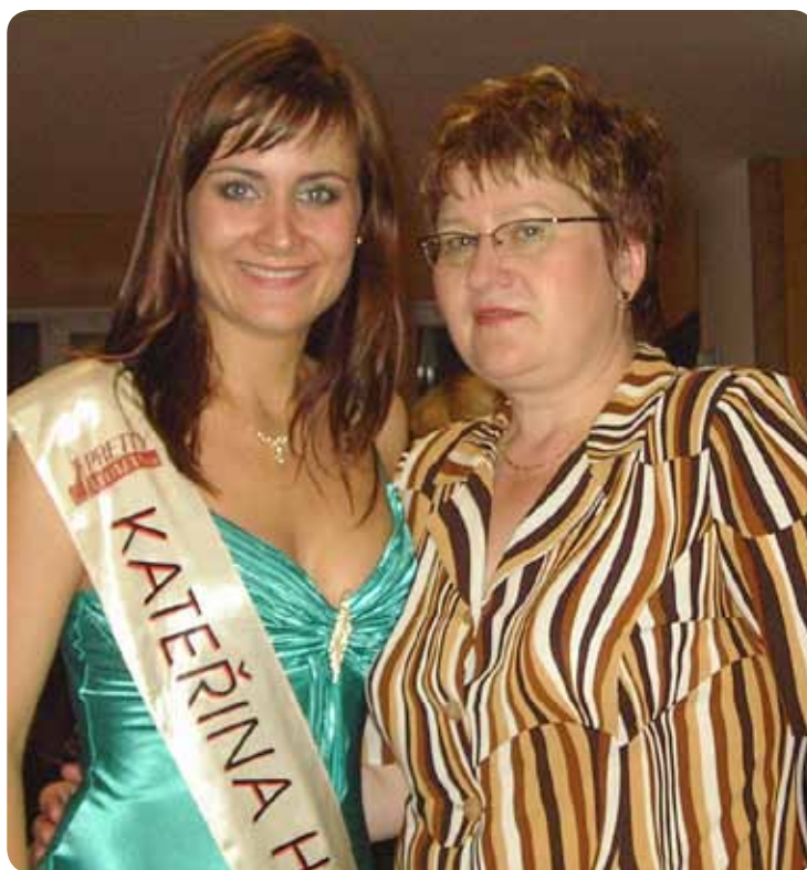
Katka s maminkou na snímku z Pretty Woman Katka with her Mom at the Pretty Woman Contest

Ze soutěží krásy to byla Miss Poupe a soutěž Pretty Woman 2007. Co se týče vědomostních soutěží, prošla jsem také nejrůznějšími olympiádami na střední škole a poměrně nedávno jsem se účastnila rodinné soutěže 5 proti 5, kterou vysílá TV Prima. Ve srovnání s mojí mámou je to ale pořád málo. Ta už prošla Milionáře, Ber nebo neber, Naslepo a mnoho dalších... V podstatě mě k tomu vede právě ona, protože mě do většiny soutěží přihlásila. Můj největší úspěch přišel v soutěži Pretty Woman, kde jsem prošla do semifinálového kola za Moravskoslezský kraj a nakonec jsem skončila za MSK čtvrtá.