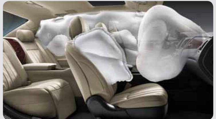
Airbagy zajišťují maximální bezpečí / Airbags providing maximum safety

Equus was being tested in the long-term. To achieve perfection, over 300 test cars were made to pass all kinds of tests under very demanding conditions. It is said that the bigger the car is, the more difficult it gets to achieve full score at the crash tests.