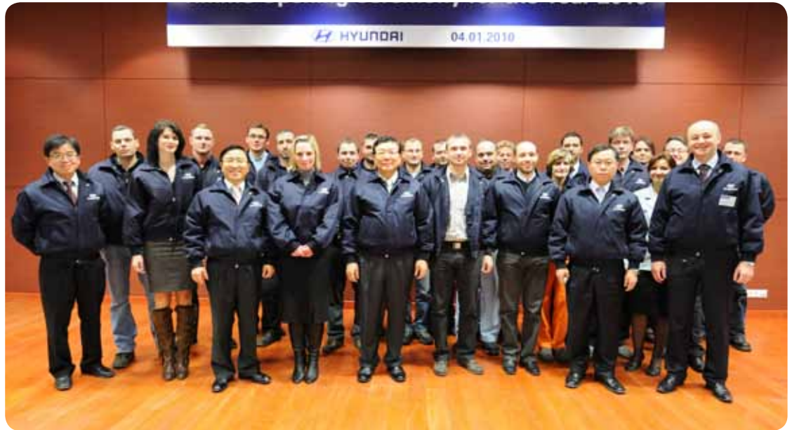
Všichni nominovaní zaměstnanci s vedením HMMC / All nominated employees with HMMC management