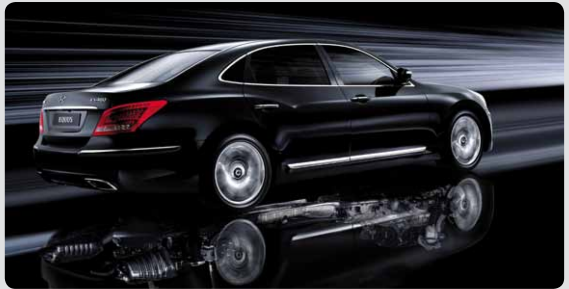
Nové linie se od původní verze značně odlišují / New shape differs a lot from the predecessor

Motor, který Hyundai Equus využívá, tedy TAU V8 s obsahem 4,6 l a výkonem 269 kW, byl americkým serverem Wardsauto zařazen do první desítky nejlepších motorů roku 2009. Oceněn byl především pro svůj výkon, tichost a šetrnost k životnímu prostředí. V říjnu loňského roku společnost představila prodlouženou verzi Equusu druhé generace (Equus Stretch Edition). Model je delší o dalších 30 cm, těžší o 100 kg a pod kapotou má motor Tau V8 o objemu 5,0 l, jehož výkon dosahuje na 294 kW. Vznikla dokonce i speciální prezidentská limuzína – vůbec první pancéřované auto korejské výroby připraveno pro bezpečnostní účely – své využití najde např. na summitu G20 v Koreji v letošním roce.