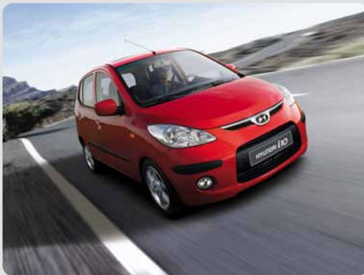
Hyundai i10 můžete mít i s bonusem za 179,000 CZK You can get your Hyundai 10 for a favorable price of 179,000 CZK

Kompletní ceníky a technické údaje najdete na stránkách dovozce značky Hyundai, tedy na www.hyundai.cz .