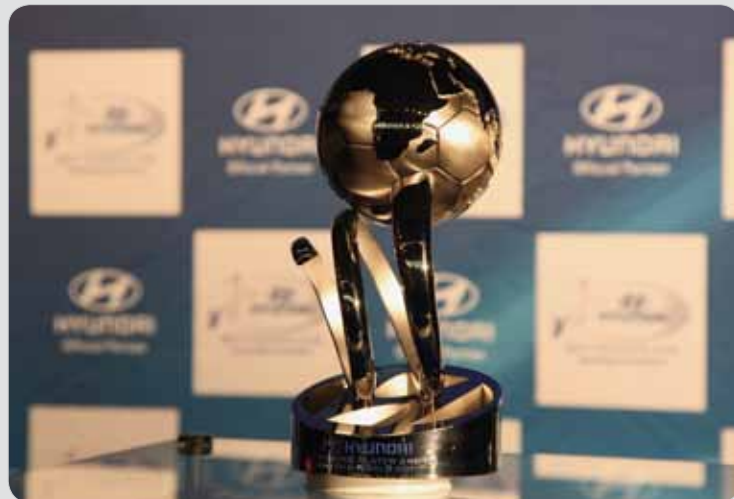
Cena, která čeká na nejlepšího fotbalistu do 21 let / Award awaiting the Best Young Player

playing footballer under 21 years who shows his skills at the above-mentioned world cup. Except for the award praised by FIFA technical group the winner also gets a new SUV Hyundai ix35. If you want to guess a winning candidate in this competition you have the opportunity. Organizers of BYPA competition created space with the name "Hyundai Best Player Award" on their web sites www.FIFA.com , where you can find all details about the inquiry and information on how to participate.