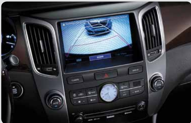
Equus nabízí pomoc při parkování / Equus offers a parking guide system

Last October the company presented a prolonged version of the new Equus (Equus Stretch Edition). The model is further 30 cm longer, 100 kg heavier and is driven with the 5.0 Tau V8 engine with the power of 294 kW. There was even a president's version made – it is the first bullet-proof Korean car ever. It has been designed for the sake of safety purposes and will be used for instance at the G20 summit in Korea in 2010.