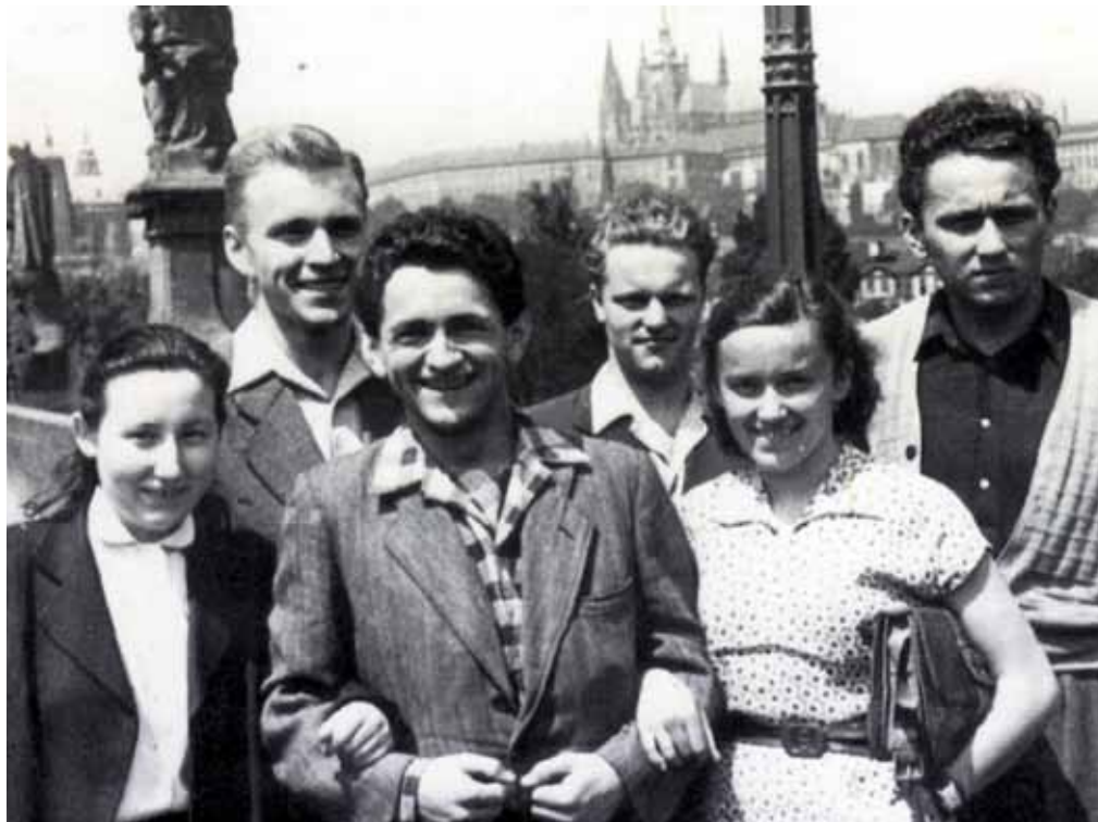
Univerzita Karlova byla jedním z prvních míst na světě, kde byl už v roce 1950 založen vědecký obor koreanistika a první studenti se začali učit tento nelehký jazyk.

K vytvoření právního rámce pro rozvíjení oboustranně prospěšné spolupráce v oblasti politické i ekonomické významně přispěly návštěvy prezidenta V. Havla v KR (1992) a prezidenta Kim Young-sama (1995) v ČR. Byly podepsány důležité dokumenty jako Dohoda o podpoře a vzájemné ochraně investic a Dohoda o zamezení dvojího zdanění, později Dohoda o vědeckotechnické spolupráci, Smlouva o sociálním zabezpečení aj. Po vstupu ČR do EU v r. 2004 se bilaterální vztahy v ekonomické oblasti řídí Rámcovou dohodou mezi EU a KR z r. 2001. Další četné dokumenty o spolupráci byly podepsány v oblasti vědy, školství, kultury aj.