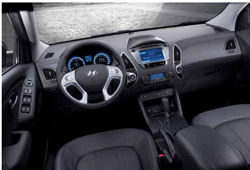
Interiér nabízí cestujícím vynikající komfort // Interior offers outstanding comfort for passengers

Nový vůz Hyundai ix35 se objeví v celoevropské síti 2350 prodejců