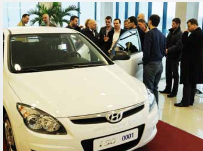
Fleetoví zákazníci navštívili 11. března závod HMMC Fleet customers visited HMMC plant on 11 th March

Fleetoví zákazníci jsou nároční a jedním z jejich specifík bývají i zvláštní požadavky na zbarvení vozidel. A tak ačkoli modely z Nošovic vyrábějí v deseti barevných provedeních, nemusí to vždy postačovat. V tomto ohledu umí HMMC vyjít svým zákazníkům vstříc a vyrobit jim jejich vozy přesně v zadaném „corporate“ odstínu, které odpovídají firemním barvám zákazníka. Příplatek za zvláštní barvu mimo standardní katalog je běžný také u všech dalších modelů. Největší zájem je dlouhodobě o tmavší barvy, jako jsou Stone Black či Steel Gray a také o stříbrnou metalízu. Ta bývá ostatně vděčným odstínem i v případě řady fleetových provozovatelů – třeba kvůli remarketingu, protože stříbrná barva je obecně velmi oblíbená.