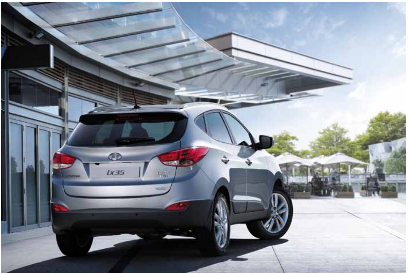
Hyundai ix35 je delší, širší a nižší než jeho předchůdce Tucson // Hyundai ix35 is longer, wider and lower than its predecessor Tucson

Hyundai ix35 will be available with four equipment levels - Classic, Comfort, Style and Premium. Buyers will be able to choose from nine exterior and three interior colors. New active safety features, fitted as standard in most countries, include ESP (Electronic Stability Program), a new Rollover Sensor