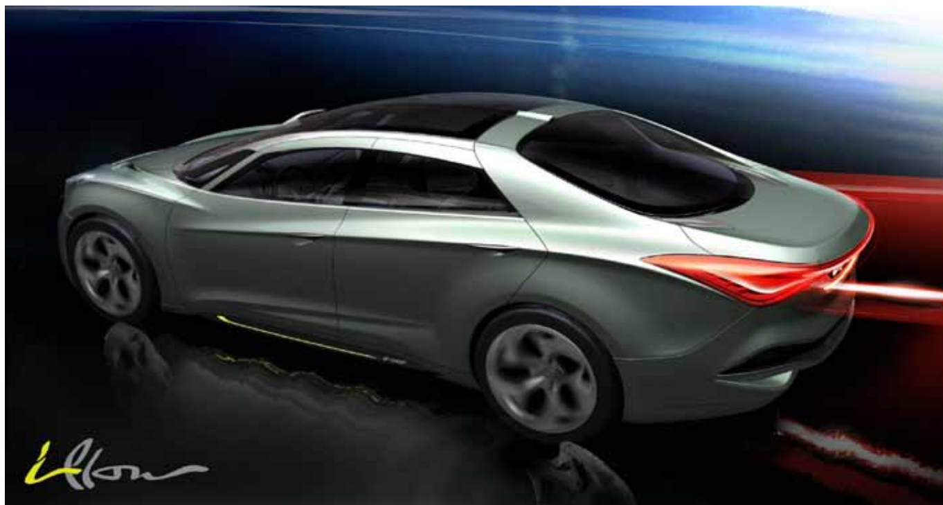
Budoucnost vozů segmentu D - koncept i-flow // The future of D-segment cars - i-flow concept car

Looking one step beyond the Blue Drive models, the new ix35 FCEV moves the Hyundai brand closer to the commercialization of hydrogen fuel cell electric vehicles. This new arrival brings several important