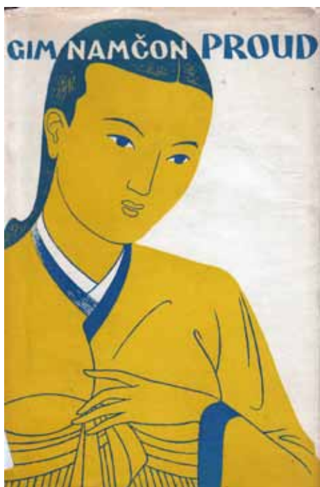
Ve 30. letech vyšly první překlady knih z korejštiny do češtiny