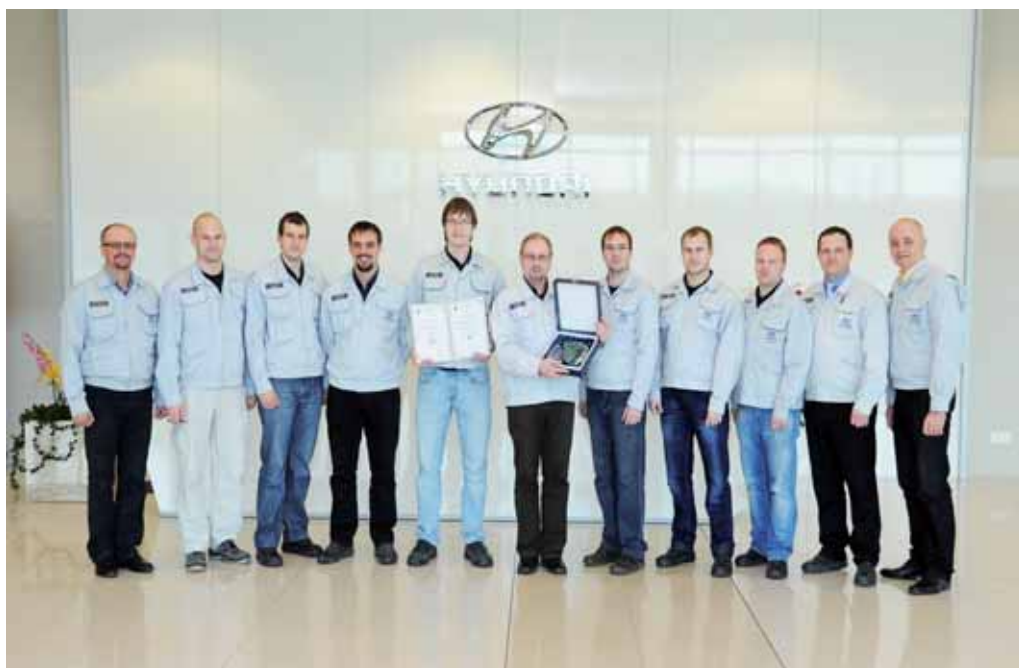
Členové sekce BOZP a specialisté bezpečnosti z jednotlivých hal HMMC Health and Safety Section members and H&S specialists from particular HMMC shops

Zástupci společnosti HMMC převzali 22. října v Praze ocenění Bezpečný podnik, které Státní úřad inspekce práce uděluje firmám dodržujícím nejvyšší standardy bezpečnosti práce a ochrany životního prostředí. Toto ocenění je závěrem dlouhodobého procesu implementace systému Bezpečný podnik, kterou provedla sekce BOZP ve spolupráci s dalšími odděleními naší společnosti.