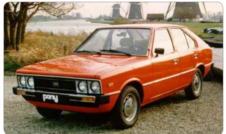
Prvním sériově vyráběným vozem značky Hyundai byl Hyundai Pony The first mass produced car of the brand was Hyundai Pony

Hyundai Club CZ organizes annual reunion in various regions of the Czech Republic. This year the event is located in the Moravian-Silesian Region from 4 th to 6 th