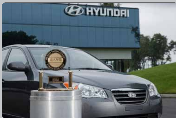
Elantra a její letošní ocenění // Elantra and its new Award

The chart of top ten assessed brands from IQS is attached above.