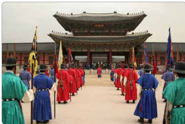
Výměna stráží u královského paláce // Change of Guards at the Royal Palace

We were guests of Hyundai and our program was demanding. Especially it was focused professionally, but it obviously included many interesting historical places. I was amazed by the giant plant in Ulsan