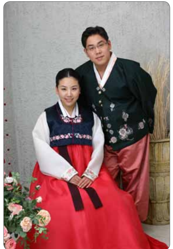
Nevěsta a ženich v tradičním hanboku Bride and Groom in Traditional Hanbok

or two weeks and nowadays there are favorite destinations like South-East Asia, islands in Pacific Ocean, Europe and the USA. Majority of parents wish for the bride to come back with a honeymoon baby.