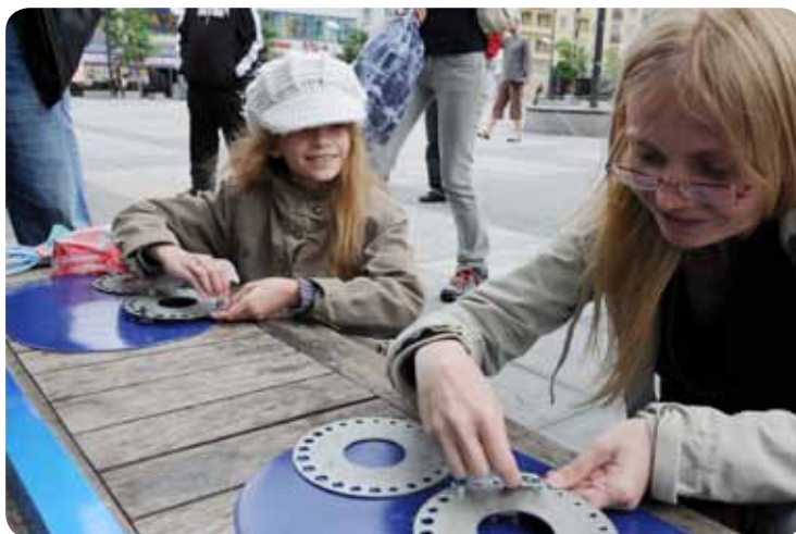
V testech zručnosti vynikaly zejména děti It was mainly children, who succeeded in skill tests