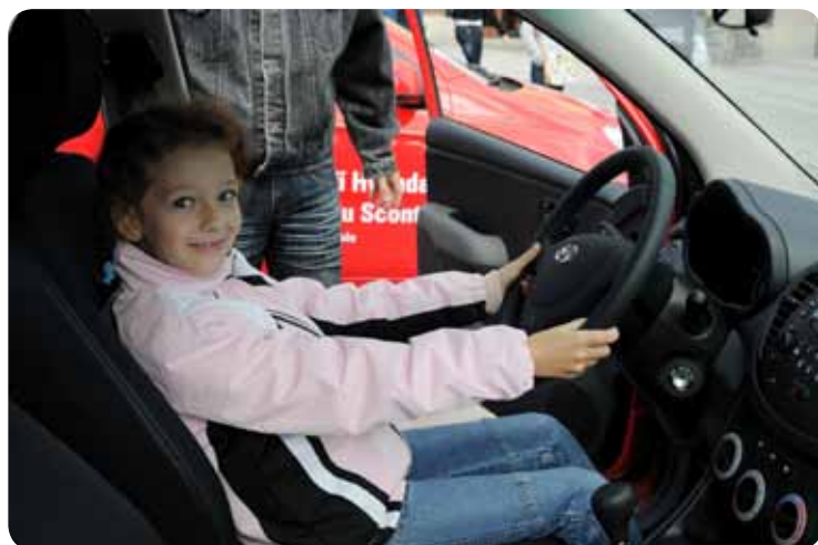
Budoucí řidička vozu Hyundai... Future Driver of a Hyundai Car...

The event was accompanied with a number of competitions focused on knowledge of HMMC and also on skills that the competitors had to use when doing manual tests commonly used at entry interviews in HMMC. The winners were awarded with Hyundai umbrellas, i30 car models and the children got some plush toys.