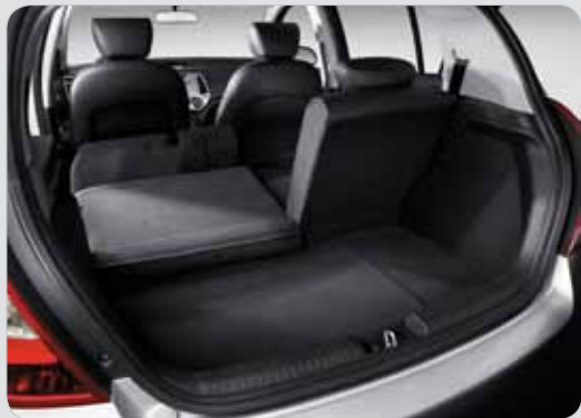
Při cestování ve dvou snese i20 i kufrů navíc At traveling in a couple i20 brings space for some extra luggage

Currently Hyundai i20 is manufactured in Indian Chennai plant, while from May 2010 the part of production determined for European market shall be moved to the Turkish plant in Izmit. Main competitors of this model include Škoda Fabia, Peugeot 207 or Ford Fiesta. In early 2009 also a three-door version of i20 was introduced to satisfy mainly younger generation.