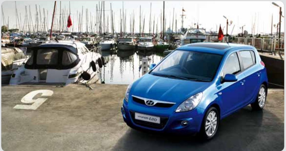
i20 v jednom z celkem 10 dostupných barevných provedení // i20 in one of 10 available colours

Prvky, které při porovnání s předchůdcem vyzdvihují jak tvůrci i20 tak nejhrůznější kritici, jsou zejména větší rozměry, zpracovaný interiér a celkově modernější tvary. Hyundai i20 je ve srovnání s Getzem o 115 mm delší a o 45 mm širší. Znatelný pokrok v rozměrech nastal u kufru, který je schopen pojmut 295 litrů (o 41 více), a pokud využijete sklopení zadních sedaček, pak se