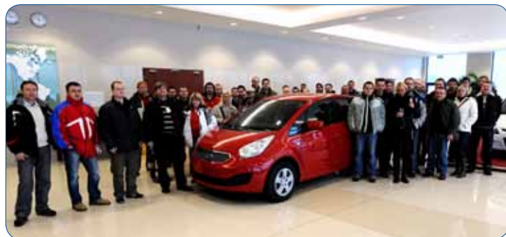
Jedna ze skupin hostů semináře Kia Venga // One of the Kia Venga workshop guests

equipment. The trainers also dealt with safety protection system and key technologies used in the vehicle. The workshop was pro-active and thus the dealers had a chance to try presenting the car to a customer. The technical part of the program was focused on technical aspects of the car operation, while the part devoted to competition presented current situation in the car market, namely in the segment of Venga including its competitors. Finally, the dealers took a ride in Kia Venga and in other B segment cars too. According to dealers' evaluation, Kia Venga proved to be a strong player that has to be taken seriously.