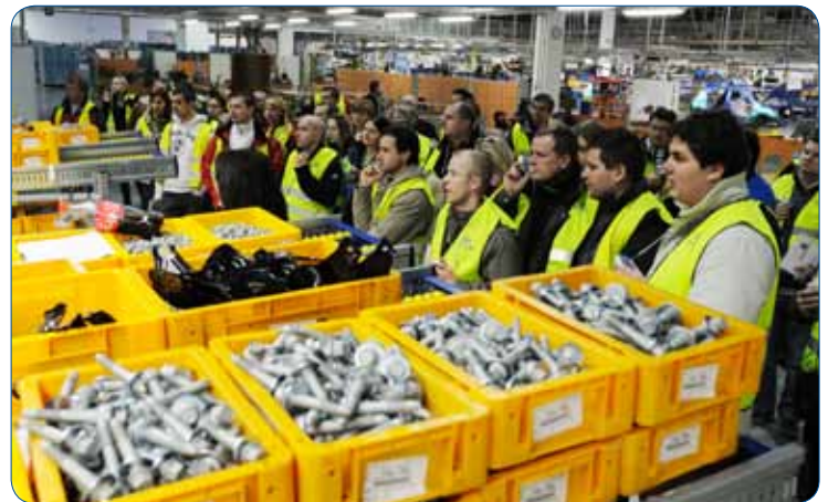
Součástí programu byla i prohlídka závodu HMMC The program included also HMMC site tour

During the second week of January HMMC was visited by total 165 Kia brand dealers divided into three groups. They were guests of four special workshops organized in HMMC