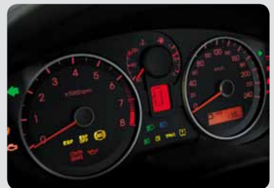
Přehledná přístrojová deska řidiče potěší Drivers may appreciate a well-arranged dashboard

Uvnitř nabízí Hyundai i20 jak větší prostor, tak řadu prvků, které podporují celkový komfort. Příjemný je zejména přístrojový panel s velmi dobře a přehledně čitelnými údaji. Pevné čalounění u předních sedadel, na které je potřeba si nejdříve zvyknout, se jeví jako pohodlné, a to hlavně díky boční-