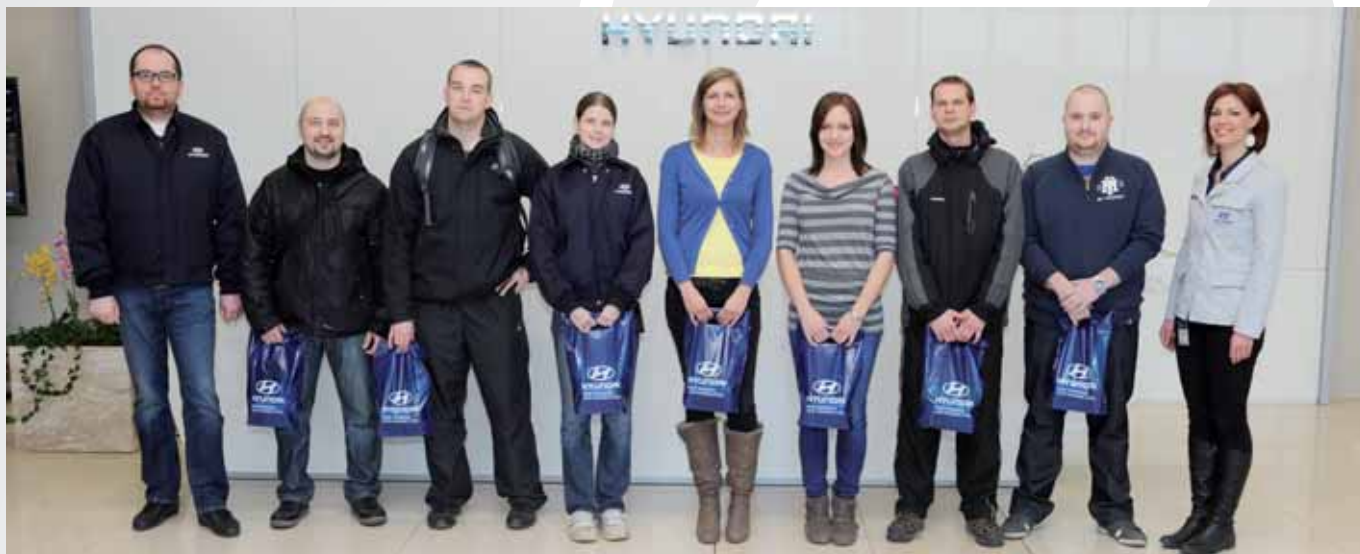
Vylosovaní účastníci průzkumu obdrželi dárkové balíčky / Drawn participants of the survey received gift packages

Milí kolegové, minulý měsíc proběhl průzkum spokojenosti s naším časopisem HMMC News, kde jste mohli vyjádřit své náměty a připomínky - co se vám líbí nebo nelíbí, jaké rubriky máte nejraději, či co v našem měsíčníku naopak postrádáte. Průzkumu se zúčastnilo celkem 250 zaměstnanců. Potěšilo nás, že téměř 94 % respondentů čte časopis pravidelně, přičemž více než 98 % všech zúčastněných považuje jeho obsah za zajímavý. Sešla se také celá řada podnětných návrhů a připomínek. Těm nejčastějším budeme věnovat následující řádky. Podrobnou statistiku výsledků pak naleznete na nástěnkách. Opakujícím se požadavkem bylo více novinek z autoprůmyslu a informací o modelech, včetně technických detailů. Neméně častým požadavkem však bylo také více informací o lidech, kteří zde pracují, a o tom, co se v HMMC děje. Rádi vám budeme nadále přinášet obojí. Od tohoto čísla jsou například zařazeny pravidelně krátké ankety s pracovníky na aktuální téma. Pokud jde o technické detaily, HMMC News není jen interním periodikem, ale je distribuován i mimo závod, což je potřeba zohlednit i při výběru informací, které mohou být takto publikovány. Několikrát jsme zaznamenali také přání, aby se v HMMC News objevovaly i články o závodech jiných automobilek nebo srovnávací