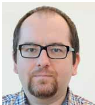
Vážené kolegyně a čtenáři časopisu HMMC News,

v rukou držíte březnové číslo firemního magazínu společnosti Hyundai Motor Manufacturing Czech. Co jsme pro vás tentokrát připravili? Můžete se těšit mimo jiné na zajímavé informace z 84. mezinárodního autosalonu